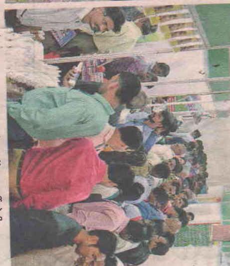
प्रदर्शनाच्या पहिल्याच दिवशी प्रत्येक स्टॉलवर गर्दी होती.