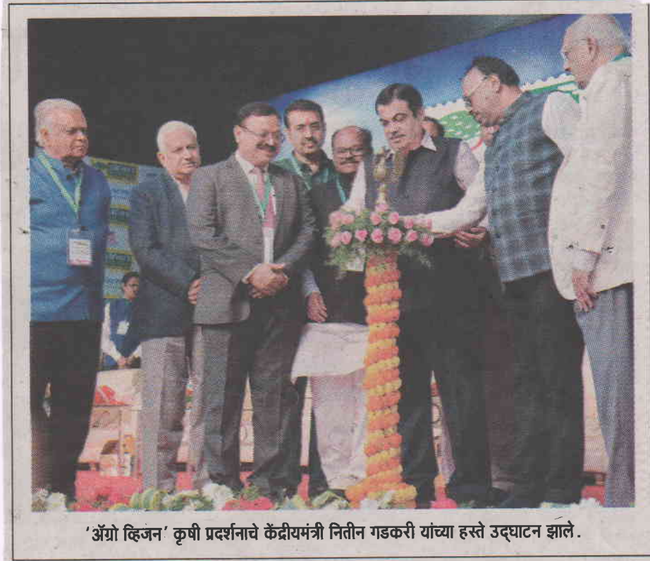
'अॅग्रो हिजन' कृषी प्रदर्शनाचे केंद्रीयमंत्री नितीन गडकरी यांच्या हस्ते उद्घाटन झाले.