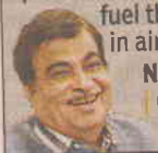
NITIN GADKARI UNION TRANSPORT MINISTER

Neeri is working on a project to extract oil out of bamboo. As much as 40% oil can be extracted from bamboo, and it can be processed to make the fuel that is used in aircraft