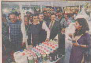
Union minister Nitin Gadkari inaugurated Agrovision at Reshimbagh ground on Friday

“No matter who comes to power, the government will run systematically and we will be able to get our work done and ensure that farmers' interests are protected