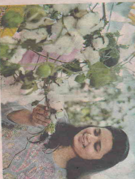
कापसाचे वेगवेगळी विकसित वाण प्रदर्शनात आहेत.