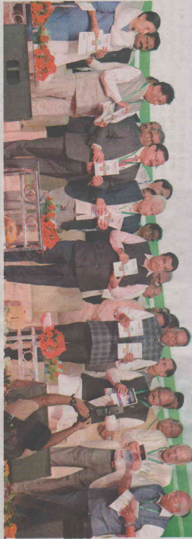
‘अंग्रेो व्हिजन’ कृषी प्रदर्शनात शेती विषयक माहिती देणाऱ्या पुस्तकातचे प्रकाशन करण्यात आले