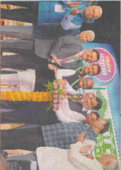
(Left) Union Minister Nitin Gadkari lighting the traditional lamp to mark inauguration of Agrovision at Reshimbagh Ground. (Right) Visitors looking at the improved varieties of fruits at one of stalls in Agrovision.

Gadkari said that based on the feedback from farmers, he is planning to establish the training institute. Agrovision had successfully completed 10 years of disseminating valuable information on how to raise income of farmers by adopting latest techniques in agriculture. But, this knowledge needs to be available throughout the year. The training institute will be a boon for farmers as they will have access to highly qualified faculty members, lab, R&D